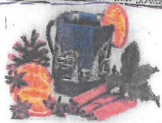
Glüh- und Apfelwein