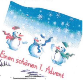
Einen schönen 1. Advent